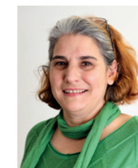
Claire Clareton Handicap