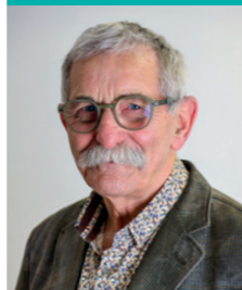
Alain Parent Social – Santé – Bien vieillir – Habitat