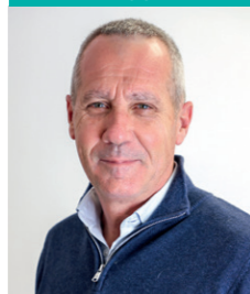
Denis Serre Environnement Transition Énergétique Prévention des risques majeurs